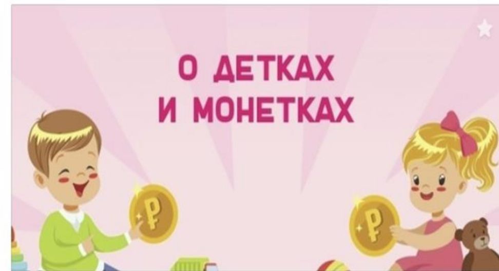
Спецпроект "О детках и монетках"

"Детки и монетки", который помогает узнать, как лучше говорить с детьми о деньгах и обучать их основам финансовой грамотности. Родители малышей, а также учеников младших классов научатся объяснять «подводные камни» использования банковских продуктов и основы экономических отношений на примере сказок и специальных финансовых игрушек. Материалы спецпроекта можно посмотреть по ссылке.